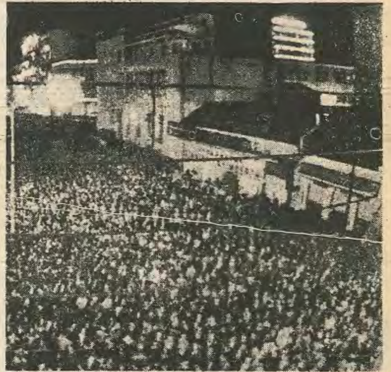
Από την προεκλογική συγκέντρωση του ΠΑΣΟΚ στη Λάρισα.

Από την άλλη, είναι αμφίβολο αν η ΕΔΗΚ του κ. Μαύρου είναι διατεθειμένη να συνεργαστεί με τις αριστερές